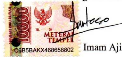
Imam Aji Santoso